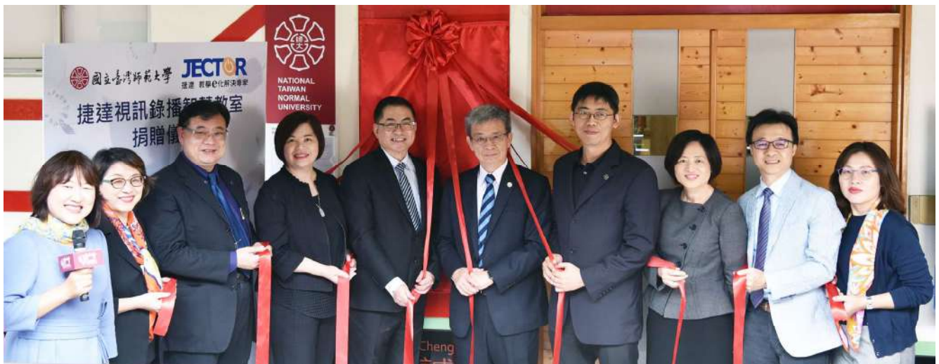
誠大樓302教室揭牌儀式