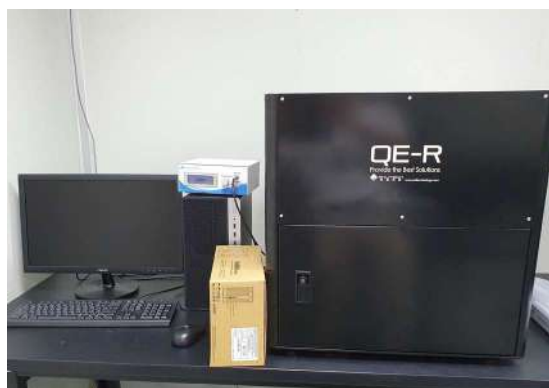
量子效率測量設備