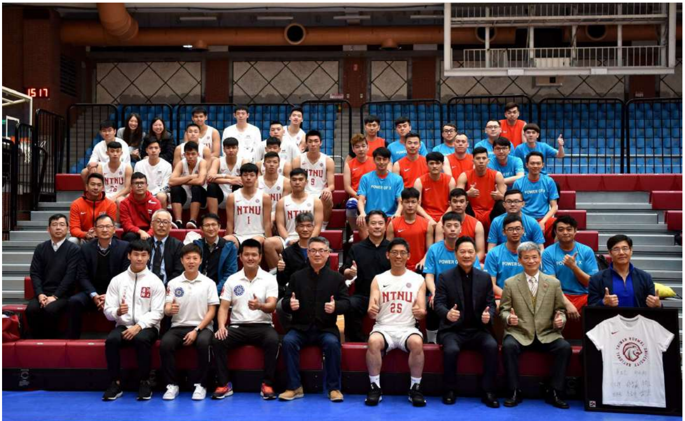
精誠資訊團隊蒞校與臺師大運動代表隊交流

精誠資訊與本校除前述技術合作之外，另提供本校運動代表隊每年新臺幣200萬元整專款，以支應運動代表隊參賽訓輔、器材採購、選手生活照顧、及課業輔導之用。此項捐贈專款分別核予男子甲組籃球代表隊120萬元、射箭代表隊40萬元、體操代表隊30萬元和其他運動代表隊10萬元之經費運用，2020年度由於疫情關係，暫停辦理所有國(內)外重要競賽，唯一完賽項目為「男子甲組籃球-108學年度大專籃球運動聯賽亞軍」。專款經費將持續針對選手進行運動科學化訓練與傷害防護，並建立科技導向的技戰術分析機制，以高效能方式協助選手儲備體能、維持賽場上最佳運動狀態。