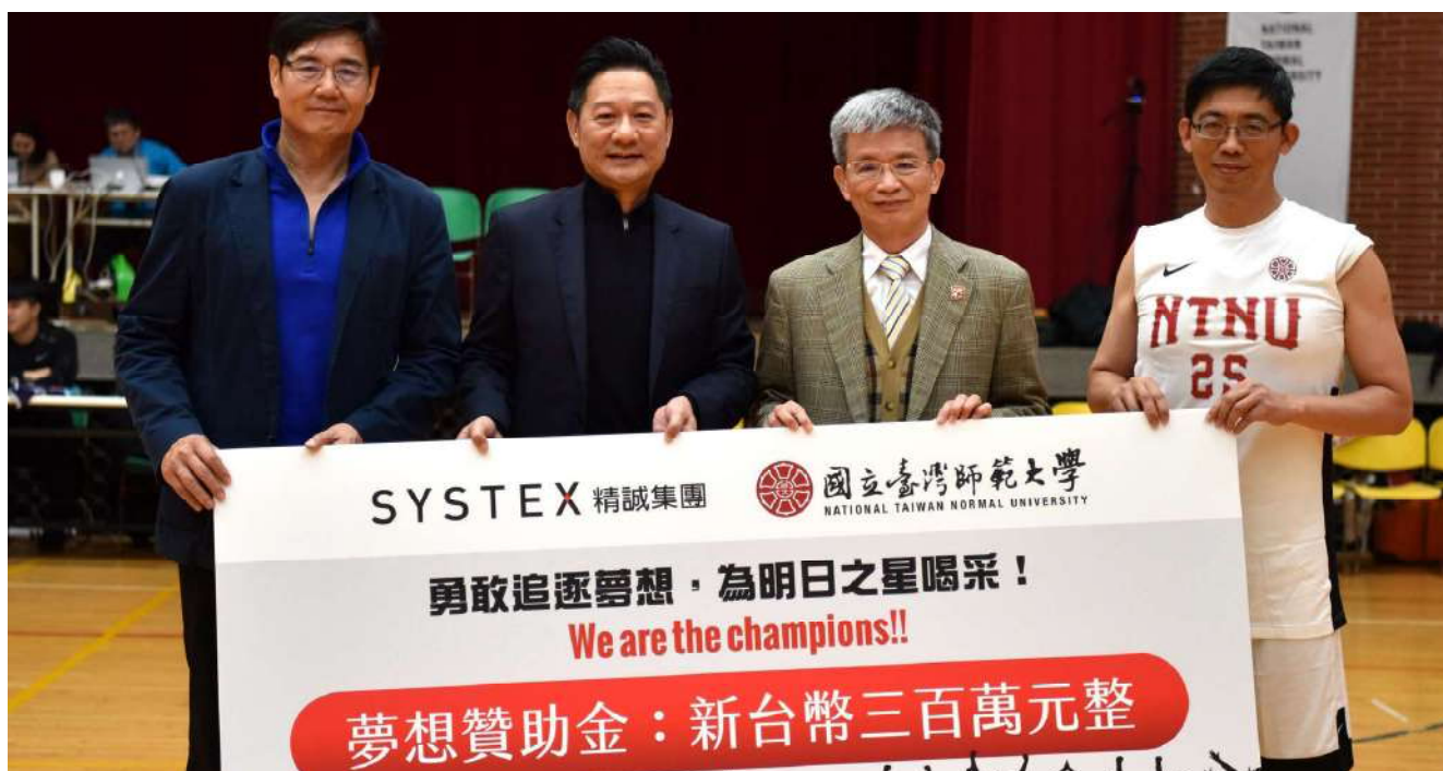
精誠資訊股份有限公司捐贈夢想起飛獎助學金

此外，臺師大為增強培育國際化人才，特別接受精誠資訊股份有限公司捐贈新臺幣100萬元成立「夢想起飛-精誠資訊獎助學金」，及日本公益財團法人似鳥國際獎學財團捐贈新臺幣50萬元成立「似鳥國際獎學金」，以獎勵本校學生拓展國際視野、積極參與國際友好親善活動，並開發學生解決社會問題與發揮社會影響力之創新實踐能力。