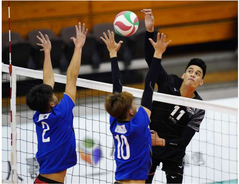
108學年度大專排球聯賽冠軍賽

排球隊平時訓練絲毫不馬虎，在球館維持一週至少五天訓練，另外每年也會進行一到兩次的移地訓練，每次為期三到五天。過去曾與麥寮高中、高雄臺電等隊伍進行訓練賽，一方面驗收球隊技術上的練習成效，另一方面則藉由移地訓練讓球員心理層面獲得成長。