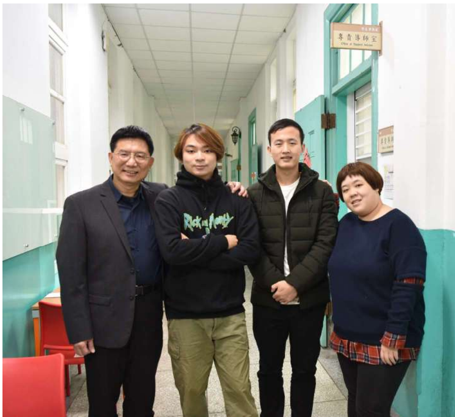
專任導師主動關切協助學生完成申請

在吳正己校長的帶領下，協同學生事務處、國際事務處、僑生先修部三個行政團隊，共同規劃此項紓困助學方案。由立法院前院長王金平、金仁寶集團董事長許勝雄、承德油脂董事長李義發、泉新工業董事長涂鐵雄、得泰國暨醫療集團總裁呂聯宗、謝許瑛文化藝術基金會創辦人謝貞德、金牛微電子董事長張大立、私立育達科技大學董事長王育文、臺灣知識庫董事長邱昌其、龍門勵學基金會董事長倫景雄等10位臺師大校友及社會人士出資捐款，以行動支持臺師大助學計畫，為學子寒中送暖。