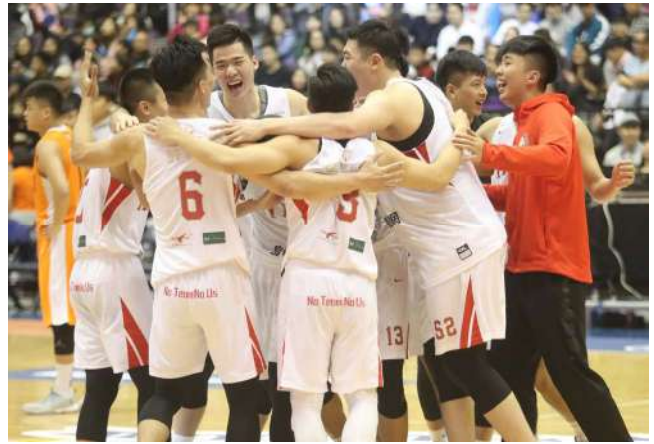
大專校院籃球運動聯賽

資訊將企業的社會責任付諸於實際行動，扶助極具潛力的學生選手、為臺灣籃球運動培育優秀人才。他亦強調，企業界的持續贊助，幫助的不僅是臺師大籃球隊，更促進臺灣職業籃球的整體發展，鼓舞提升社會大眾的運動風氣，對社會產生正面積極的影響力，具有不可斗量的價值。